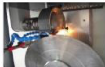
115° circular saw grinding