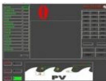
PNK-CNC General operating screen